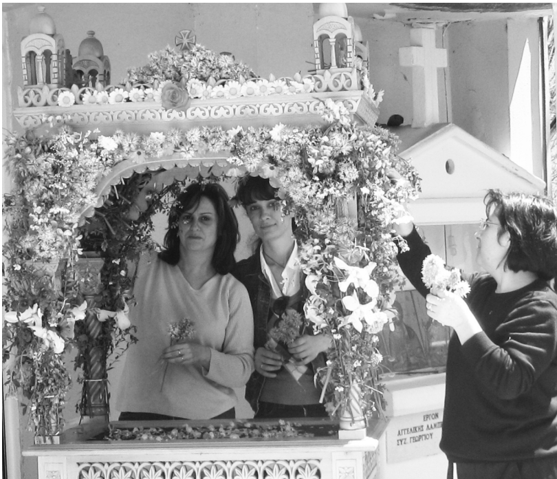
Το στόλισμα του επιταφίου

Γ ιορτάστηκε ήσυχα το Πάσχα στην πυρόπληκτη Μάκιστο. Στη Μάκιστο που αγωνίζεται να Αναστηθεί. Κι όπως φαίνεται, ο χρόνος άρχισε να μετράει αντίστροφα και αργά-αργά να γιατρεύει τις πληγές των ανθρώπων. Μεγάλη ελπίδα αποτέλεσε το ευχάριστο γεγονός ότι κάποια σπίτια, λίγα έστω, ολοκληρώθηκαν ή σχεδόν ολοκληρώθηκαν και κάποιοι συγχωριανοί μας είχαν τη χαρά να φιλοξενηθούν σ' αυτά για τις Άγιες μέρες. Αυτό ήταν ίσως το σημαντικότερο γεγονός για το δεύτερο Πάσχα μετά την καταστροφή και έδωσε μια