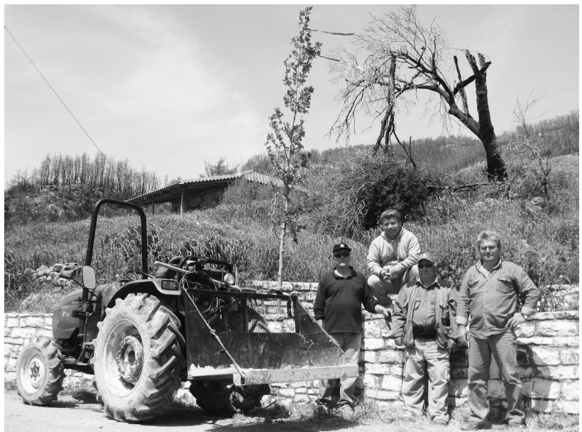
Στιγμιότυπο από τη δενδροφύτευση στον Αη - Γιώργη

ελπίδα σε όλους, ότι η Μάκιστος θα ξαναγεννηθεί. Βέβαια και πάλι απουσίαζαν πολλοί. Εκείνοι που χάθηκαν στη φωτιά υπάρχουν στις μνήμες. Κάποιοι που οι ηλικιωμένοι γονείς τους μένουν ακόμη στα κοντέινερ, τους πήραν μαζί τους σε άλλα μέρη, ενώ άλλοι έστησαν το γιορταστικό τραπέζι έξω από τα κοντέινερ. Λιγοστοί βρεθήκαμε στην εκκλησία για τον Επιτάφιο που έγινε στις 5 μμ και ακολουθήσαμε την περιφορά με ...λιακάδα, ενώ η Ανάσταση έγινε στις 9.30. Στη λειτουργία της Αγάπης ο ιερέας με τον ψάλτη και τον επίτροπο βρέθηκαν σχε-