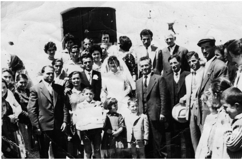
Από το γάμο της, το 1962

-Τον κορμό του. Πελεκάγαμε τον κορμό, βγάζανε τη φλύδα και τη βράζανε και βάφανε όλων των ειδών τα νήματα. Άλλο χρώμα ήτανε το καφέ, που γινότανε από τη φλύδα από τα καρύδια. Τα υπόλοιπα χρώματα τα αγοράζαμε. Κίτρινο, πράσινο, κόκκινο. Δεν θυμάμαι να φτιάχναμε άλ-