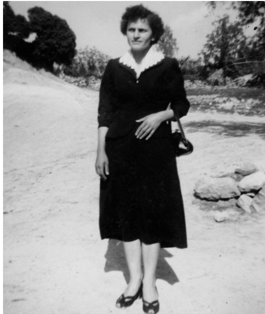
Τέλη δεκαετίας του '50 στη Μάκιστο

με κιάλας εκεί που καθόμαστε...και χορεύαμε και λέγαμε και τραγούδια και χορεύανε κι άλλοι. Στις Απόκριες, του Ευαγγελισμού ντυνόμαστε και βγαίναμε όλες οι κοπέλες και τραγουδάγαμε και χορεύαμε. Και ποιος τραγουδάγε; Πρώτη εγώ αρ-